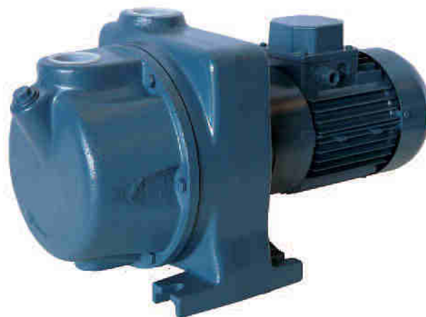
TABLA DE PRESTACIONES

Bajo demanda pueden suministrarse con soporte de rodamientos y eje libre.